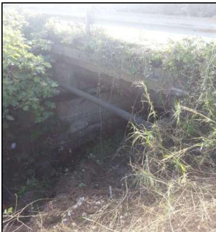
Immagine 111 - Attraversamento stradale (Sez. 25-26)