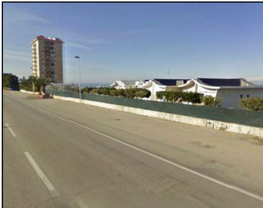
Immagine 4 - Tra Sez. 14 e 15