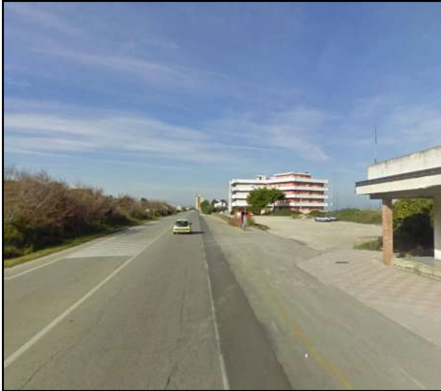
Immagine 3 - Tra Sez. 4 e 5