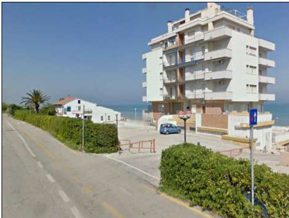
Immagine 6 - Tra Sez. 30 e 31