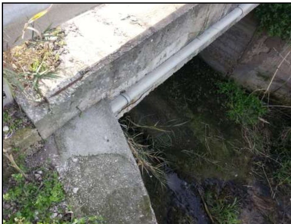
Immagine 100 - Attraversamento stradale (Sez. 37-38)