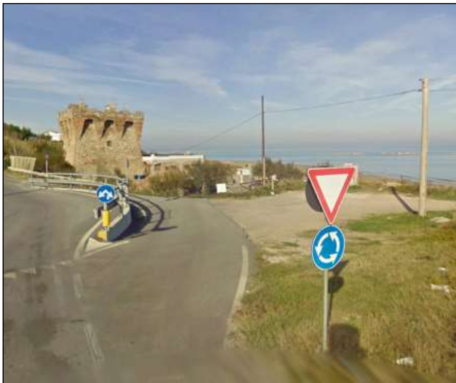
Immagine 2 - Rotonda stradale in prossimità della Torretta (tra Sez. 2 e 3)