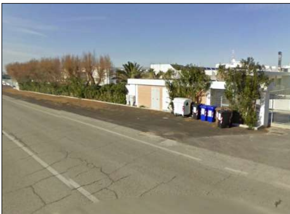
Immagine 8 - Tra Sez. 49 e 50