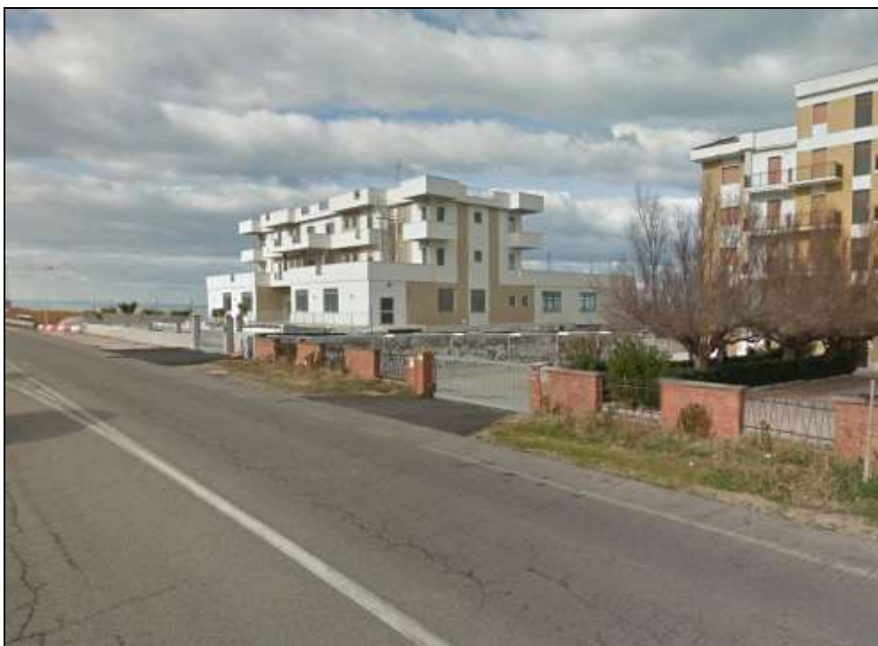
Immagine 9 - Tra Sez. 52 e 53 (termine condotta)