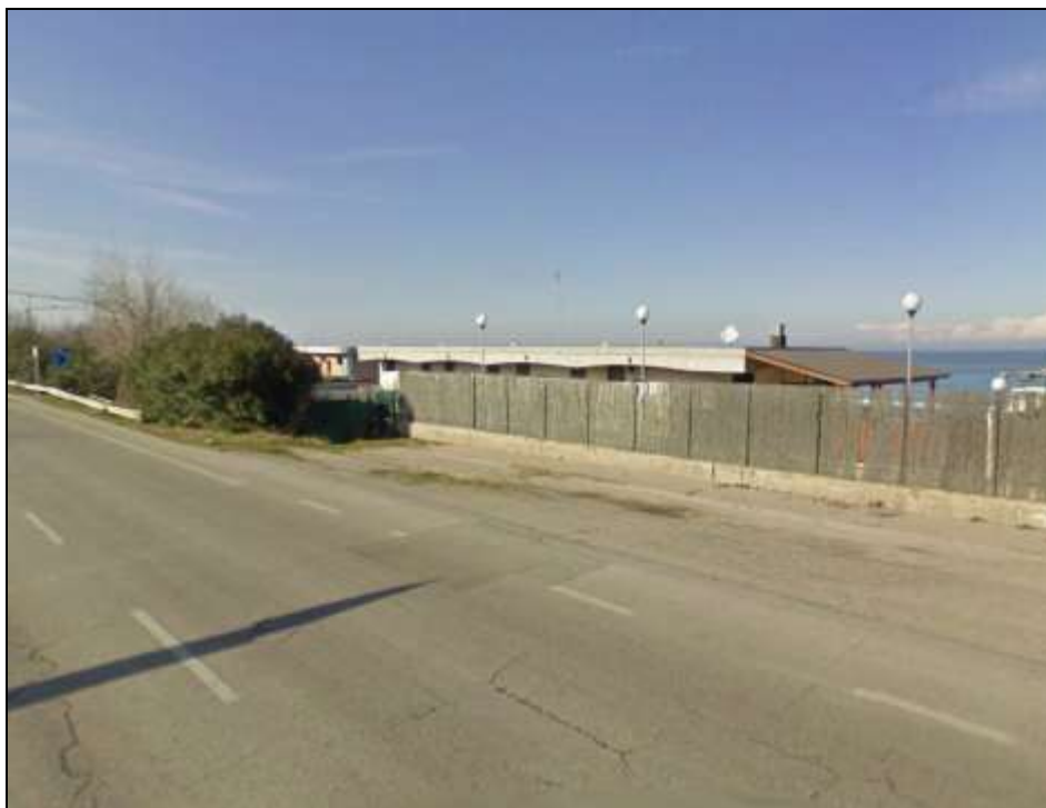
Immagine 7 - Tra Sez. 36 e 37 – Segue attraversamento aereo (sez. 37-38)